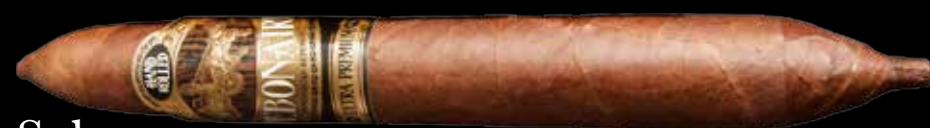
Solomone (7.75" x 58)